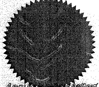
ශ්‍රී ලංකා මහ බැංකුවේ මුදල් මණ්ඩලයේ පොදු මුද්‍රාව இலங்கை மத்திய வங்கியின் நாணயச்சபையின் பொது இலச்சினை Common Seal of the Monetary Board of the Central Bank of Sri Lanka